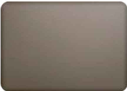
Ral 9007 FT