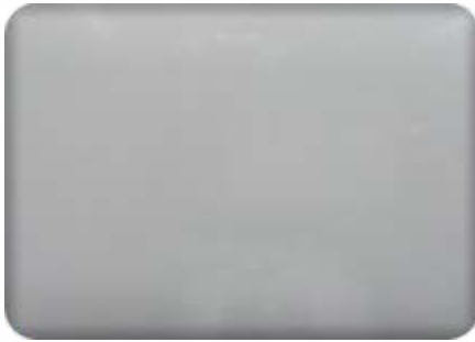
Ral 9006 gloss