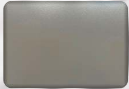
Ral 9007 matt