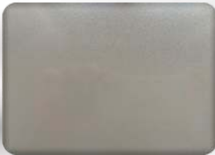
Ral 9007 gloss